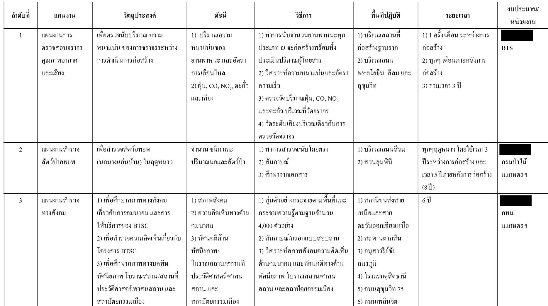
ตารางที่ 2.1-1 แผนการติดตามและตรวจสอบผลกระทบสิ่งแวดล้อมโครงการก่อสร้างรถไฟฟ้ากรุงเทพมหานคร